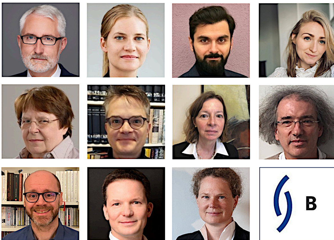
Der neue Vorstand des DRB Berlin